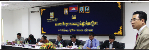
ការការពារនិក្ខេបបទរបស់និស្សិតថ្នាក់បណ្ឌិត - អនុបណ្ឌិត និងថ្នាក់បរិញ្ញាបត្រ