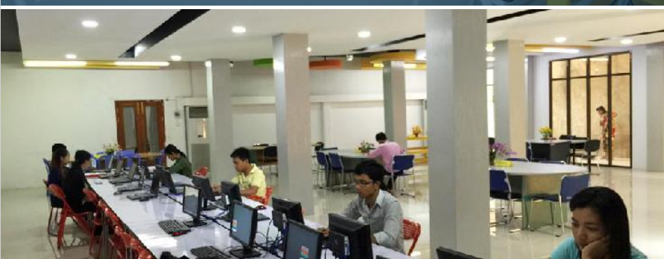
ជាមួយនិងបណ្ណាល័យដែលទើបតែងតែបន្ថែមថ្មីបានជំរុញបរិស្ថាន សិក្សា ស្រាវជ្រាវ ពិភាក្សា បែងចែក ជាចំណុចសំខាន់របស់សាកលវិទ្យាល័យបានផ្តល់ជូន