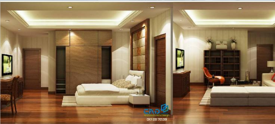
បន្ទប់ពិសោធន៍សណ្ឋាគារបានរៀបចំឡើង ០៣កម្រិតស្តង់ដារមាន Suite room-Deluxe room និង Superior room ជាមួយបរិក្ខារប្រើប្រាស់ទាន់សម័យ បម្រើឱ្យការអនុវត្ត ស្របទៅតាមតម្រូវការទិផ្សារវិភាគចម្រើននាពេលបច្ចុប្បន្ន