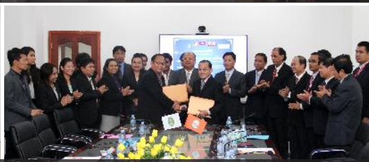
កម្មវិធីផ្លាស់ប្ដូរវប្បធម៌ និងពិធីចុះអនុស្សរណៈយោគយល់គ្នាជាមួយសាកលវិទ្យាល័យនានា