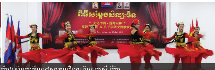
ពិធីសម្ដែងសិល្បៈចិននៅសាកលវិទ្យាល័យ អាស៊ី អឺរ៉ុប