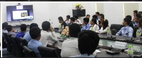
ការផ្តល់ចំណេះដឹងដល់បុគ្គលិក - សាស្ត្រាចារ្យ - និស្សិតតាមរយៈការចូលរួមក្នុងសិក្ខាសាលាដោយផ្ទាល់ និងពីចម្ងាយ