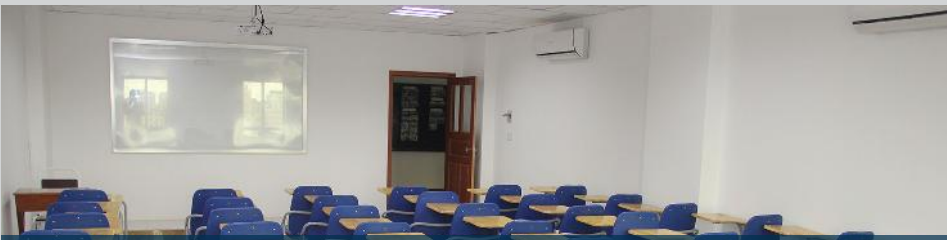
បន្ទប់រៀនធំទូលាយ បំពាក់ដោយបរិក្ខារបម្រើអោយការសិក្សាមាន ម៉ាស៊ីន LCD ប្រព័ន្ធកុំព្យូទ័រណេតវើក និងម៉ាស៊ីនត្រជាក់