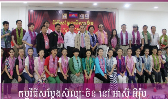
កម្មវិធីសម្តែងសិល្បៈចិន នៅ អាស៊ី អឺរ៉ុប