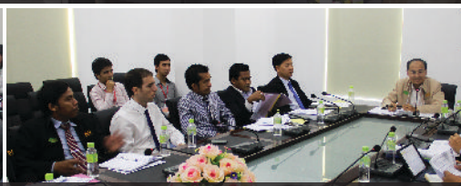
កិច្ចប្រជុំពីការងារគ្រប់គ្រង - ការអភិវឌ្ឍកម្មវិធីសិក្សា និងវគ្គបណ្ដុះបណ្ដាលដល់បុគ្គលិក