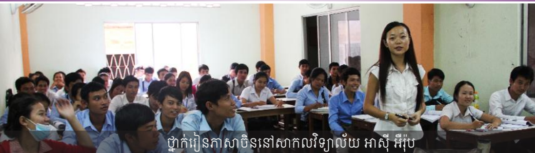
ថ្នាក់រៀនភាសាចិននៅសាកលវិទ្យាល័យ អាស៊ី អឺរ៉ុប