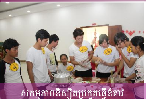
សកម្មភាពនិស្សិតប្រកួតធ្វើនំគាវ

为了培养能熟练运用汉语，具备扎实的汉语基础知识和一定的专业理论与基本的中国人文知识，熟悉中国国情和文化背景的应用汉语人才，柬埔寨王家研究院孔子学院和亚欧大学合作设立汉语本科专业。专业学制4年。全部课程均由中国籍专业教师任教。优秀学生可获得由中国国家汉办提供的奖学金赴中国学习。毕业后可获得由柬埔寨教育部颁发正规本科文凭。欢迎广大有志于从事汉语教学、翻译及其他相关事业的学生报名！