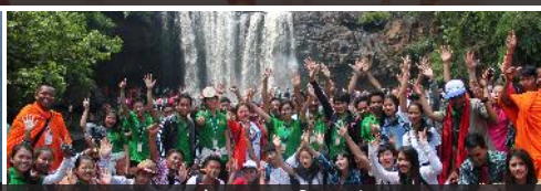
ការផ្លាស់ប្ដូរទស្សនកិច្ចសិក្សាទាំងក្នុង និងក្រៅប្រទេស របស់បុគ្គលិក-សាស្ត្រាចារ្យ-និស្សិតនៃសាកលវិទ្យាល័យ អាស៊ី អឺរ៉ុប