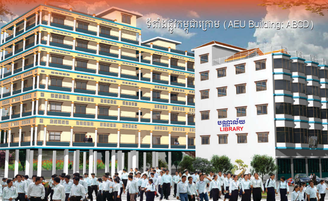
ទីតាំងផ្លូវកម្ពុជាក្រោម (AEU Building: ABCD)

ខាងក្នុងទីតាំងផ្លូវកម្ពុជាក្រោម ចម្ងាយ ៨០ម៉ែត្រ និរន្តរភាពយូរអង្វែង គុណភាពខ្ពស់ ព្រោះមានកម្មវិធីសិក្សាល្អ សាស្ត្រាចារ្យប្រកបដោយសមត្ថភាពខ្ពស់ និងមានអគារសិក្សាផ្ទាល់ខ្លួន