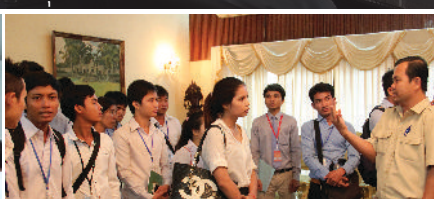
ការហាត់ការងារដោយផ្ទាល់របស់និស្សិតជាមួយស្ថាប័នដែលជាដៃគូទាំងក្នុង និងក្រៅប្រទេស