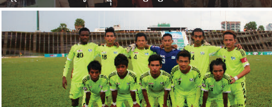
សមាគមកីឡារបស់សាកលវិទ្យាល័យ អាស៊ី អឺរ៉ុប ត្រូវបានមហាជនទទួលស្គាល់ទូទាំងប្រទេស