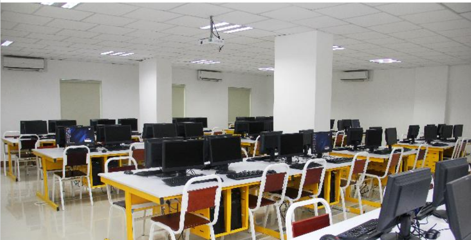
បន្ទប់ពិសោធន៍ផ្នែកវិទ្យាសាស្ត្រកុំព្យូទ័រដំណើរការដោយម៉ាស៊ីនមានបច្ចេកវិទ្យាខ្ពស់ អនុវត្តន៍ជាមួយម៉ាស៊ីនបម្រើពិភពប្រាក់ដ (Server) ជាមួយនឹងអ៊ីនធឺណិតមានល្បឿនលឿន