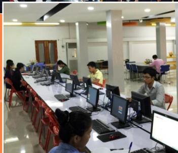
អគារបណ្ណាល័យ