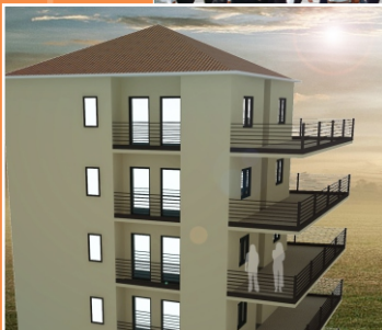
អគារស្នាក់នៅសម្រាប់និស្សិត