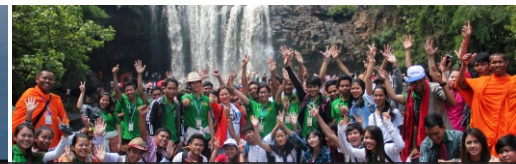
ការផ្លាស់ប្តូរទស្សនកិច្ចសិក្សាទាំងក្នុង និងក្រៅប្រទេស របស់បុគ្គលិក-សាស្ត្រាចារ្យ-និស្សិតនៃសាកលវិទ្យាល័យ អាស៊ី អឺរ៉ុប