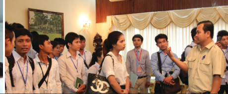
ការហាត់ការងារដោយផ្ទាល់របស់និស្សិតជាមួយស្ថាប័នដែលជាដៃគូទាំងក្នុង និងក្រៅប្រទេស