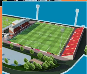
កីឡាមណ្ឌលសាងសង់បាន៤០%