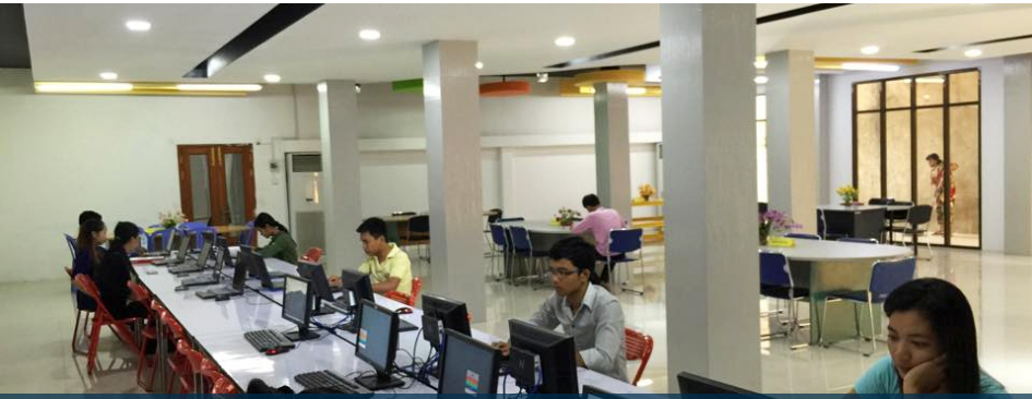
ជាមួយនិងបណ្តាល័យដែលទើបពង្រីកបន្ថែមថ្មីបានជំរុញបរិស្ថាន សិក្សា ស្រាវជ្រាវ ពិភាក្សា បែងចែក ជាចំណុចសំខាន់របស់សាកលវិទ្យាល័យបានផ្តល់ជូន