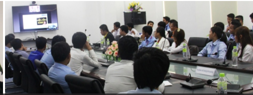
ការផ្តល់ចំណេះដឹងដល់បុគ្គលិក - សាស្ត្រាចារ្យ - និស្សិតតាមរយៈការចូលរួមក្នុងសិក្ខាសាលាដោយផ្ទាល់ និងពីចម្ងាយ