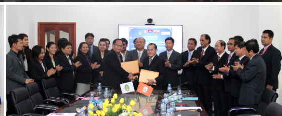
កម្មវិធីផ្តល់ប្តូរវប្បធម៌ និងពិធីចុះអនុស្សរណៈយោគយល់គ្នាជាមួយសាកលវិទ្យាល័យនានា