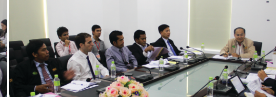
កិច្ចប្រជុំពីការងារគ្រប់គ្រង - ការអភិវឌ្ឍកម្មវិធីសិក្សា និងវគ្គបណ្តុះបណ្តាលដល់បុគ្គលិក