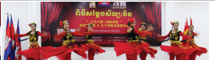
ពិធីសម្តែងសិល្បៈចិននៅសាកលវិទ្យាល័យ អាស៊ី អឺរ៉ុប