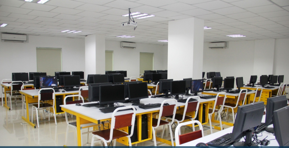
បន្ទប់ពិសោធន៍ផ្នែកវិទ្យាសាស្ត្រកុំព្យូទ័រដំណើរការដោយម៉ាស៊ីនមានបច្ចេកវិទ្យាខ្ពស់ អនុវត្តន៍ជាមួយម៉ាស៊ីនបម្រើពិភពប្រាកដ (Server) ជាមួយនឹងអ៊ីនធឺណិតមានល្បឿនលឿន