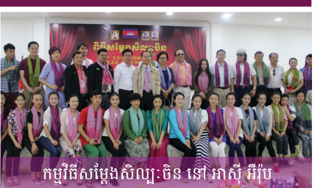
កម្មវិធីសម្តែងសិល្បៈចិន នៅ អាស៊ី អឺរ៉ុប