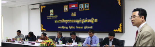
ការការពារនិរន្តរ៍របស់និស្សិតថ្នាក់បណ្ឌិត - អនុបណ្ឌិត និងថ្នាក់បរិញ្ញាបត្រ