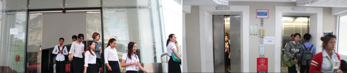
បំពាក់ដោយទ្វារបើកបិទដោយស្វ័យប្រវត្តិ និងជណ្តើរយន្តទំនើប