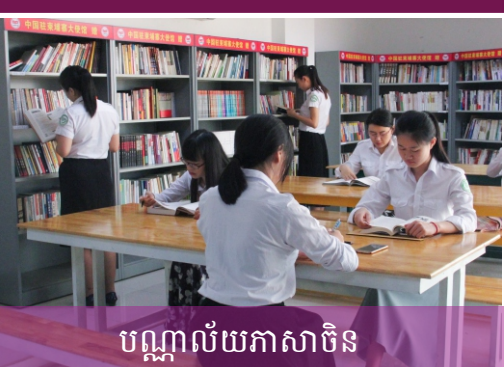
បណ្ណាល័យភាសាចិន

为了培养能熟练运用汉语，具备扎实的汉语基础知识和一定的专业理论与基本的中国人文知识，熟悉中国国情和文化背景的适应现代国际社会需求的全面发展的应用汉语人才，柬埔寨王家研究院孔子学院和亚欧大学合作设立汉语本科专业。专业学制4年。全部课程均由中国籍专业教师任教。优秀学生可获得由中国国家汉办提供的奖学金赴中国学习。毕业后可获得由柬埔寨教育部颁发正规本科文凭。欢迎广大有志于从事汉语教学、翻译及其他相关事业的学生报名！