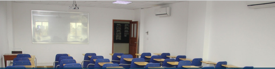
បន្ទប់រៀនធំទូលាយ បំពាក់ដោយបរិក្ខារបម្រើអោយការសិក្សាមាន ម៉ាស៊ីន LCD ប្រព័ន្ធកុំព្យូទ័រណេតវើក និងម៉ាស៊ីនត្រជាក់