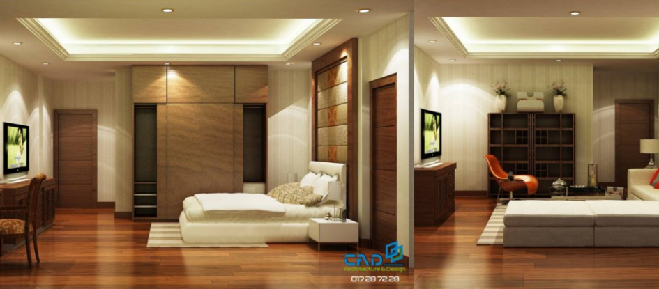
បន្ទប់ពិសោធន៍សណ្ឋាគារបានរៀបចំឡើង ០៣កម្រិតស្តង់ដារមាន Suite room- Deluxe room និង Superior room ជាមួយបរិក្ខារប្រើប្រាស់ទាន់សម័យ បម្រើឱ្យការអនុវត្ត ស្របទៅតាមតម្រូវការទីផ្សាររីកចម្រើននាពេលបច្ចុប្បន្ន