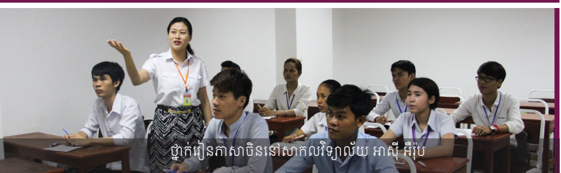
ថ្នាក់រៀនភាសាចិននៅសាកលវិទ្យាល័យ អាស៊ី អឺរ៉ុប