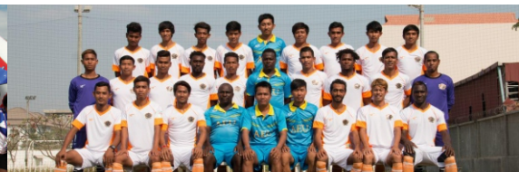
សមាគមកីឡារបស់សាកលវិទ្យាល័យ អាស៊ី អឺរ៉ុប ត្រូវបានមហាជនទទួលស្គាល់ទូទាំងប្រទេស