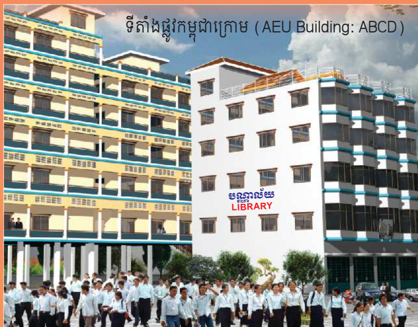
ទីតាំងផ្លូវកម្ពុជាក្រោម (AEU Building: ABCD)

និរន្តរភាពយូរអង្វែង គុណភាពខ្ពស់ ព្រោះមានកម្មវិធីសិក្សាល្អ សាស្ត្រាចារ្យប្រកបដោយសមត្ថភាពខ្ពស់ និងមានអគារសិក្សាផ្ទាល់ខ្លួន