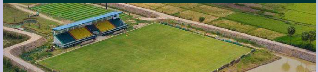
កីឡដ្ឋានសាកលវិទ្យាល័យ អាស៊ី អឺរ៉ុប

សាកលវិទ្យាល័យមានផែនការអភិវឌ្ឍន៍សម្ភារៈរូបវន្ត និងហេដ្ឋារចនាសម្ព័ន្ធរូបវន្តស្របតាមតម្រូវការជាក់ស្តែង