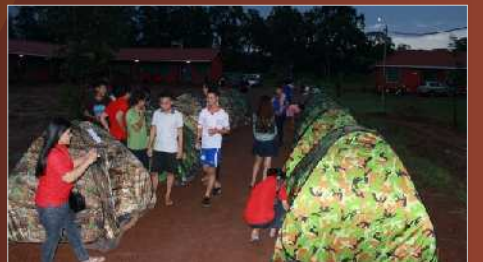
ការសិក្សាផ្សារភ្ជាប់ទៅនឹងការងារសហគមន៍