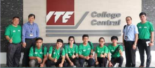
ទស្សនកិច្ចសិក្សារៀងរាល់ឆ្នាំទៅប្រទេស សិង្ហបុរី