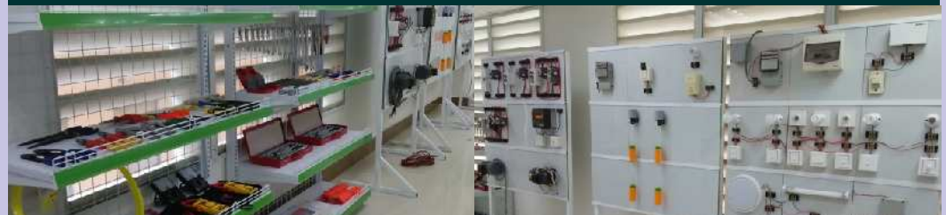
បន្ទប់អនុវត្តន៍អគ្គិសនី និងអេឡិចត្រូនិក