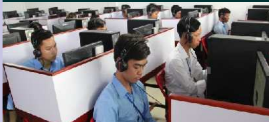
បន្ទប់ស្តាប់កាសារអង់គ្លេស ចិន