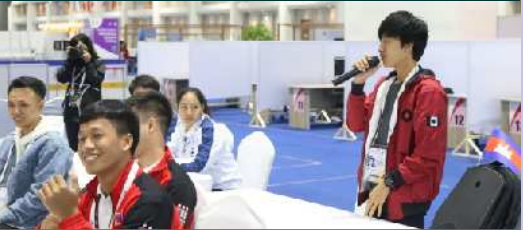
និស្សិតជំនាញ IT ចូលរួមប្រកួត Asian Skills (Thailand)