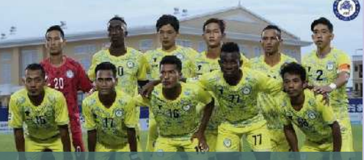
ក្រុមកីឡាបាល់ទាត់ធ្វើមប្រចាំឆ្នាំ Asia Euro United