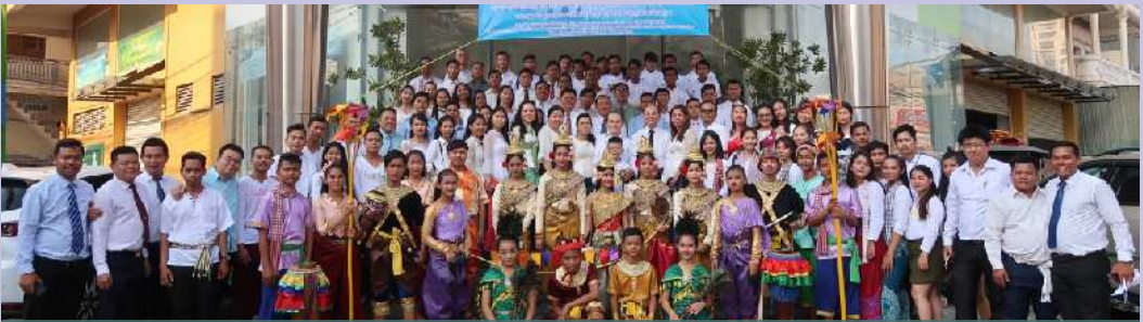
សាកលវិទ្យាល័យព្រះព្រះកម្មវិធីចូលឆ្នាំថ្មីប្រពៃណីជាតិ

យើងបានកសាងនូវផែនការយុទ្ធសាស្ត្រ ដើម្បីអនុវត្តនូវគោលនយោបាយ ប្រតិបត្តិ និងអភិវឌ្ឍន៍គ្រប់គ្រងឲ្យមានគុណភាព សមត្ថភាព ស្ថាប័នទទួលខុសត្រូវ ស្របតាមត្រឹមត្រូវនៃប្រព័ន្ធគ្រប់គ្រង និងផ្តល់ លក្ខខណ្ឌចាំបាច់ក្នុងការបំពេញការងារប្រកបដោយ ប្រសិទ្ធភាពនិងភាពស័ក្តិសិទ្ធិ ដែលជាគន្លឹះក្នុង ការជួយសិស្សឲ្យសម្រេចបានលទ្ធផល ល្អប្រសើរក្នុងការសិក្សា។