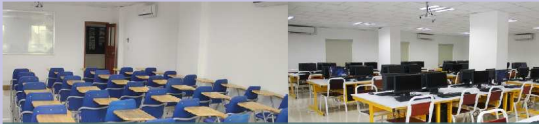
បន្ទប់រៀនបំពាក់បរិក្ខារបម្រើឲ្យការសិក្សាម៉ាស៊ីន LCDបណ្តាញកុំព្យូទ័រណេតវើក និងម៉ាស៊ីនត្រជាក់