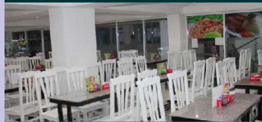
អាហារដ្ឋានបម្រើឲ្យនិស្សិត បុគ្គលិក សាស្ត្រាចារ្យ