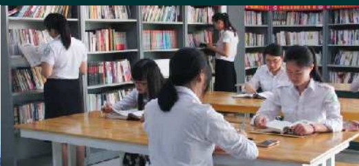
បណ្ណាល័យភាសាចិន (ទីតាំងអគារមាស)