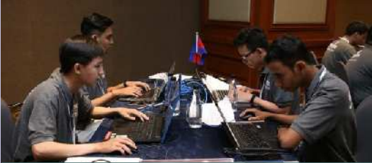
និស្សិតជំនាញ IT ចូលរួមប្រកួតអន្តរជាតិ(Singapore)