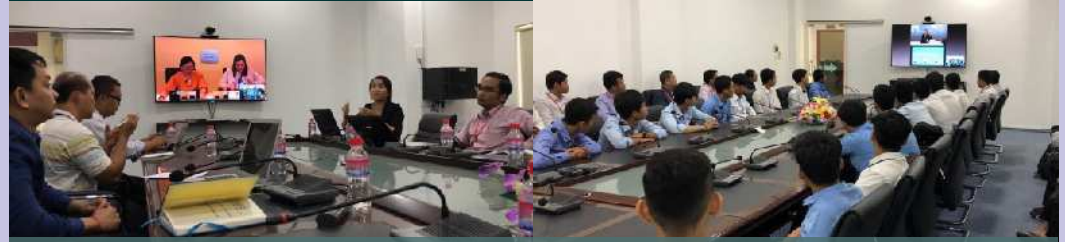
បន្ទប់សិក្សាសាលា និងប្រជុំពីចម្ងាយ