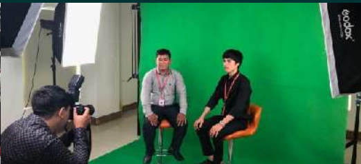
បន្ទប់អនុវត្តន៍ចតវីដេអូ និងចក្ខុបុរាណ