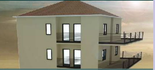
អគារស្នាក់នៅសម្រាប់និស្សិត