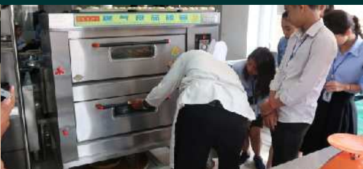
មានបន្ទប់អនុវត្តន៍ចម្អិនអាហារ និងកេសដូ: