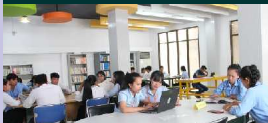
បណ្ណាល័យទូទៅ (ទីតាំងផ្លូវកម្ពុជាក្រោម)