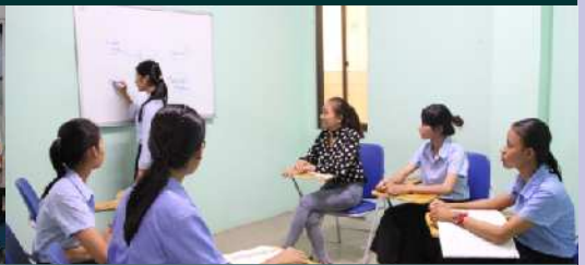
បន្ទប់សិក្សាផ្លាស់ប្តូរមតិយោបល់