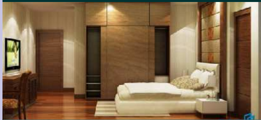
បន្ទប់អនុវត្តន៍សណ្ឋាគារ