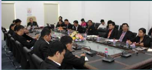
មានបន្ទប់ប្រជុំខ្នាតតូច និងធំ