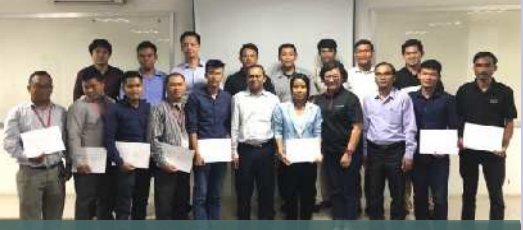
កម្មវិធីបណ្តុះបណ្តាលគ្រូពេញសិទ្ធិអន្តរជាតិ CyberObs