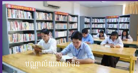
បណ្ណាល័យភាសាចិន

为了培养汉语商务型和汉语教育人才，具备扎实的汉语知识基础，熟悉中国国情和文化知识背景，亚欧大学和皇家科学院孔子学院合作，建立商务汉语本科专业，和汉语文学本科专业 学制四年，全部课程均由中国籍教师教授，优秀的学生可以申请由中国国家汉办提供的奖学金奔赴中国留学 毕业后可获得由柬埔寨教育部颁发的正规本科毕业证文凭 欢迎广大有志从事汉语教育、翻译、商务和相关工作的学生积极报名。