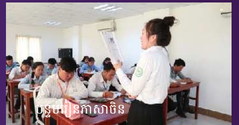
បន្ទប់រៀនភាសាចិន