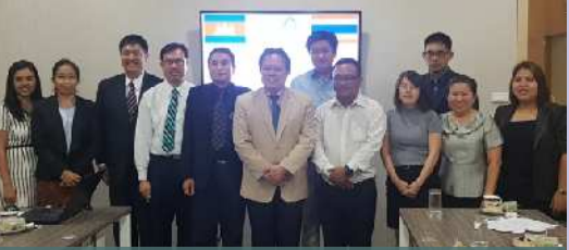
កម្មវិធីផ្លាស់ប្តូរការបង្រៀនរវាង AEU និង ARU (Thailand)