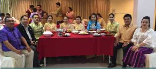
កម្មវិធីបោះជំរុំអន្តរជាតិនៅ ARU (Thailand)