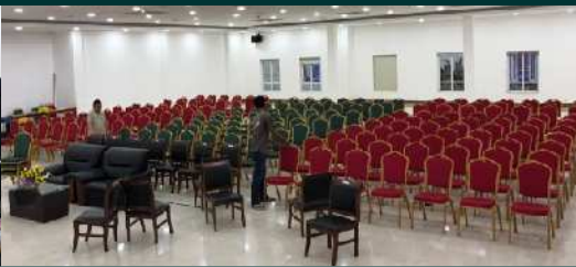
មានសាលសន្និសីទធំទូលាយ