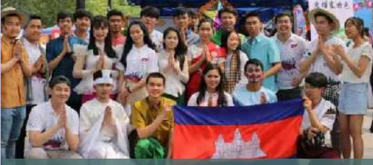
ក្រុមនិស្សិត អាស៊ី អឺរ៉ុប បន្តការសិក្សានៅប្រទេសចិន