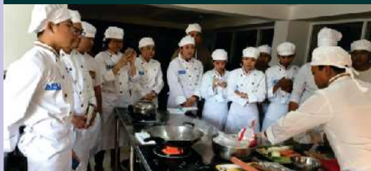
មានបន្ទប់អនុវត្តន៍ចម្អិនអាហារ និងកេសដូ: