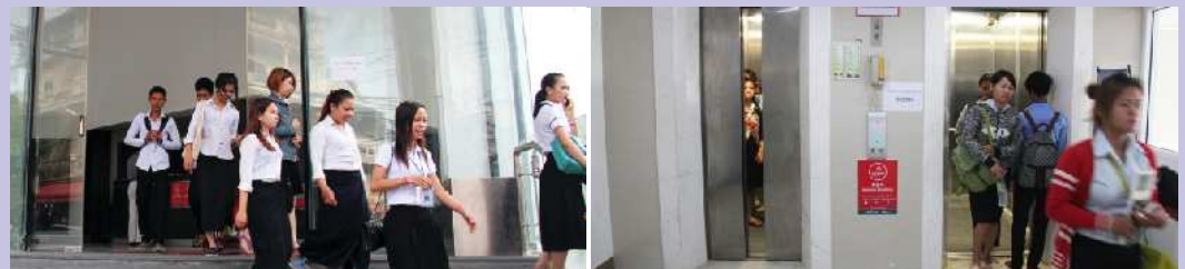
ច្រកចេញចូលធំទូលាយ និងបំពាក់ជណ្តើរយន្តទំនើប