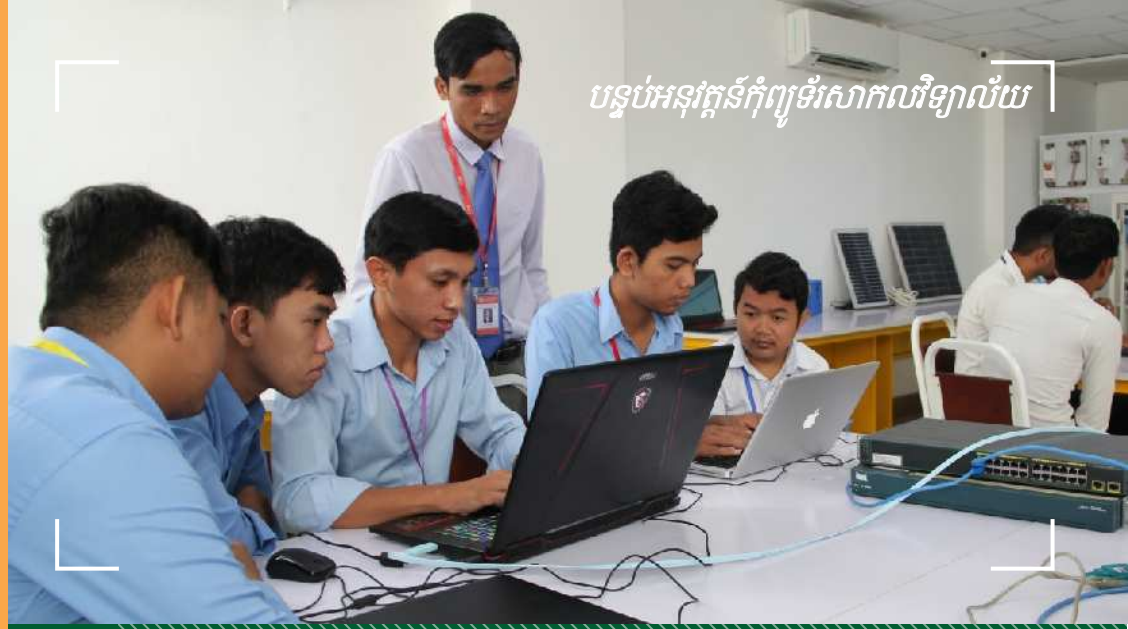
ការសិក្សាផ្សារភ្ជាប់ជាមួយ អនុវត្តន៍ឧបករណ៍សេរីវិធីជាក់ស្តែងស្របតាមទីផ្សារការងារក្នុងតំបន់

ចំណេះដឹង លើការ រៀប ចំនិង គ្រប់គ្រង ប្រព័ន្ធ ប្រតិបត្តិការ ម៉ាស៊ីន ប្រព័ន្ធ បណ្តាញកុំព្យូទ័រខ្នាតកណ្តាលនិងធំ ប្រព័ន្ធសុវត្ថិភាពបច្ចេកវិទ្យាព័ត៌មានវិទ្យា ដំឡើងកន្លែងផ្ទុកទិន្នន័យខ្នាតធំ ត្រួតពិនិត្យចរាចរណ៍ទិន្នន័យនិងការគ្រប់គ្រង ហានិភ័យទិន្នន័យ។