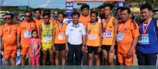
អាស៊ី អឺរ៉ុប នាំមុខមេដាយ ក្នុងក្របខ័ណ្ឌឧត្តមសិក្សានៅកម្ពុជា