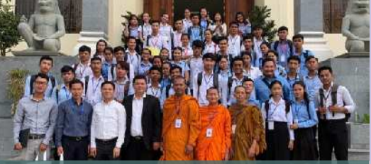
ទស្សនកិច្ចសិក្សាស្ថាប័នរដ្ឋ និងឯកជនក្នុងប្រទេស