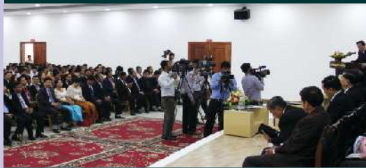
មានសាលសន្និសីទធំទូលាយ