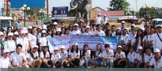
ទស្សនកិច្ចសិក្សាប្រចាំឆ្នាំទៅកាន់តំបន់ផ្សេងៗក្នុងប្រទេស