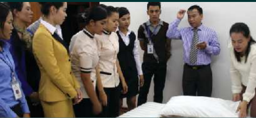
សកម្មភាពអនុវត្តន៍ការរៀបចំបន្ទប់សណ្ឋាគារ