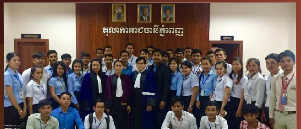
ការសិក្សាផ្សារភ្ជាប់ជាមួយការអនុវត្តនៅបន្ទប់អនុវត្តន៍របស់សាកលវិទ្យាល័យ និងការចូលរួមសិក្សាជាក់ស្តែង ពីស្ថាប័នសាលាជម្រះក្តីគ្រប់ជាន់ថ្នាក់។