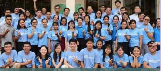
ការងារសហគមន៍ក្នុងកម្មវិធី UNDP