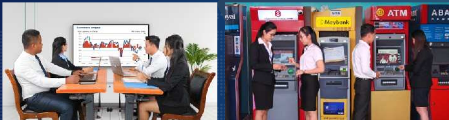
ការសិក្សាផ្សារភ្ជាប់ជាមួយការអនុវត្តនៅបន្ទប់អនុវត្តរបស់សាកលវិទ្យាល័យ និងការចុះសិក្សា ជាក់ស្តែងតាមបណ្តាក្រុមហ៊ុនជាតិ និងអន្តរជាតិដែលជាដៃគូ។