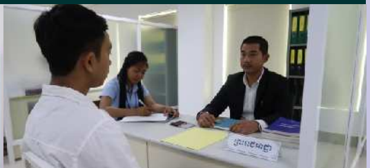
បន្ទប់លេខាធិការដ្ឋានរដ្ឋបាលសាលាដំបូង