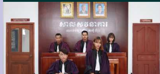
បន្ទប់អនុវត្តន៍សាលសវនាការ