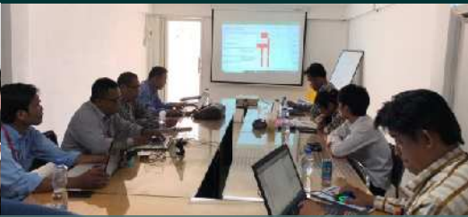
មានបន្ទប់ប្រជុំខ្នាតតូច និងធំ